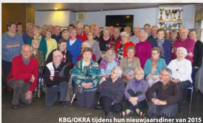
KBG/OKRA tijdens hun nieuwjaarsdiner van 2015

KBG/OKRA Erps-Kwerps bestaat op woensdag 14 oktober juist 50 jaar! Dat moet gevierd worden!