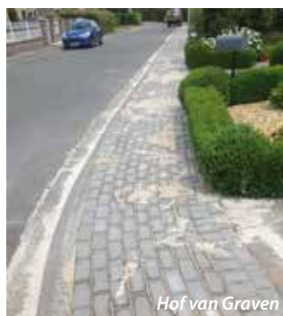
Hof van Graven

In de Sint-Amandstraat werd door middel van een vernauwing een veiligere oversteekplaats gemaakt ter hoogte van de schoolpoort.